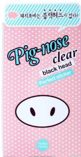
PIG NOSE CLEAR BLACKHEAD PERFECT STICKER ČISTÍCÍ NÁPLAST PORT ČERNÝM TEČKÁM

ŘEKNĚTE SBOHEM ČERNÝM TEČKÁM S KOREJSKÝM PŘÍRODNÍM PRODUKTEM PIG NOSE CLEAR BLACKHEAD PERFECT STICKER V PODOBĚ RŮŽOVÉHO PROUŽKU NA NOS, KTERÝ JE VŽDY PO RUCE. NÁPLAST ODSTRANÍ Z PLETI VŠECHNY NEČISTOTY A PŘEDEVŠÍM NEVZHLEDNÉ ČERNÉ TEČKY.