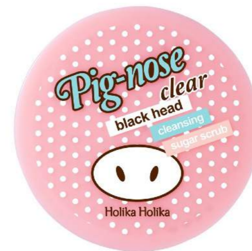
ČISTÍCÍ CUKROVÝ PEELING PIG NOSE CLEAR BLACKHEAD CLEANSING SUGAR SCRUB